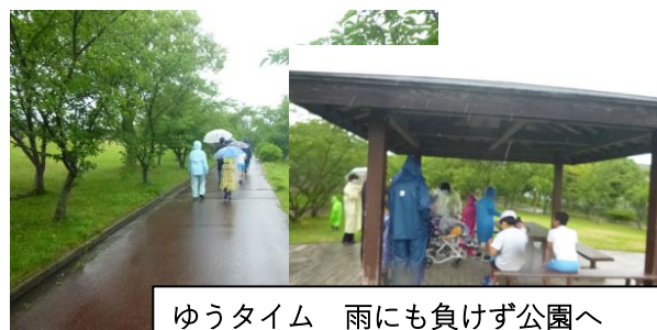
ゆうタイム 雨にも負けず公園へ

( http://www.miki.ed.jp/sh/miki/ ) か「三木市立三木特別支援学校」で検索)に本校の教育活動を掲載しています。新年度になりましたので、昨年度の方はホームを開けて校舎の写真左上の令和元年度をクリックしていただくとご覧いただけます。是非ご覧ください。