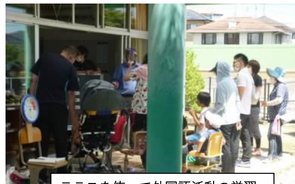
テラスを使って外国語活動の学習