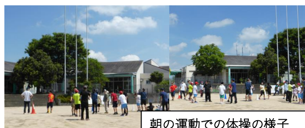
朝の運動での体操の様子

☆毎週木曜日に定時(18:00)退勤日の実施を行っています。ご理解・ご協力をお願いいたします。