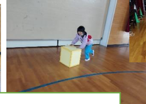
体育の時間から(小)