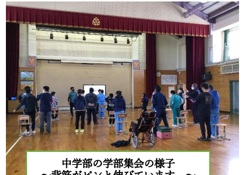
中学部の学部集会の様子 ～背筋がピンと伸びています。～