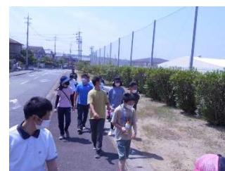
学校近郊探検から