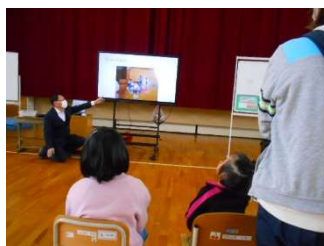
児童生徒集会から