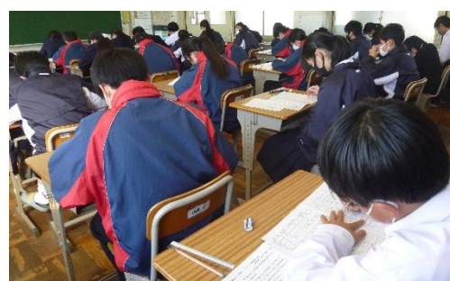
テスト真っ最中 う～ん、むずかしい…

1年生最後の定期テストはあしたで終了。今が踏ん張りどころです。みんな、頑張っ！ 祈！健闘！ そのあとは、1年生の締めくくり。登校は15日だけ。1年間を振り返って、2年生になる(「先輩」になる)心の準備をしていきましょう。