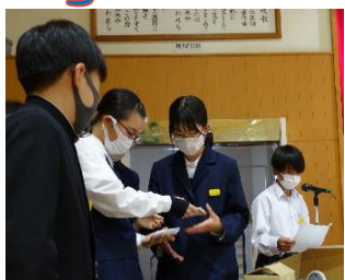
手作りの賞品がいっぱい！ どれにしようかなあ…。