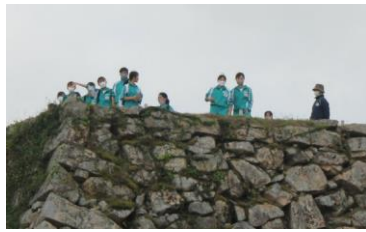
竹田城 海釣り公園