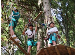
ジップライン 2年校外学習