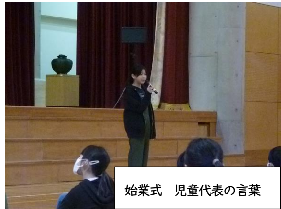
始業式 児童代表の言葉