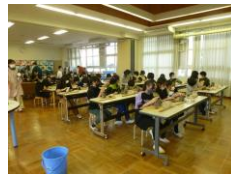
2班 4年5年6年 (38人)