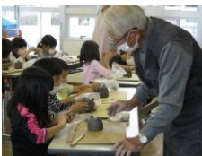
1班 1年2年3年 (40人)

やきもの たいけん ほうかごきょういっくじぎょう 焼き物体験 (放課後教育事業)