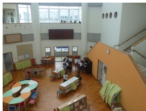
第2図書室（ピアノ演奏）