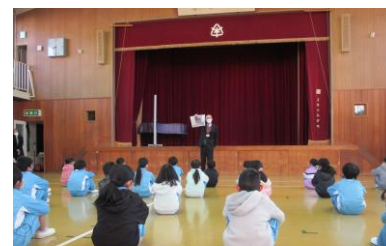
全校朝会「スリッパの話」

このことから、私たち教師や保護者の皆様が「スリッパを揃えましょう」と言うだけでなく、揃えることの目的や効果を適切に伝えて子育てをしていくことが大切であると考えます。つまり、相手が生活しやすいように考えることは、「相手のことを考えて行動する能力」が身に付いていくことを教えていくことになります。