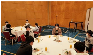
洋食をとっている様子

6年生は1泊2日の修学旅行を実施しました。学習の目的を平和学習ができる施設、社会性の育成や仲間づくりを図ることのできる施設として行き先を選定して計画しました。そこで、主な行き先を南淡路・若人の広場公園、安富白土瓦や姫路城などしました。南淡路・若人の広場公園では戦争に関する展示物を観たり、施設の方から戦争の話の聞いたりして平和学習を進めました。また、安富白土瓦では瓦粘土を使ってコースターづくりを行うことで、粘土を高温で焼くことにより風雪や雨から私たちの生活を守ってくれる屋根瓦になることを知りました。