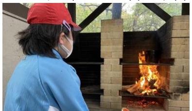
火起こしをしている様子

自然学校ではさまざまな体験プログラムを行います。その中の一つに野外炊事があります。野外炊事は火起こしを行うことから活動が始まっていきます。火起こしを担当した子どもは、チャッカマンを使って新聞紙に火を点けて薪に火を移していかなければなりません。「薪の組み方をどのようにすれば空気が通るのか」試行錯誤しながら作業を進めていましたが、点火できないで困っていました。そこで、4年生の理科の学習で学んだ空気の性質について思い出すように言いました。