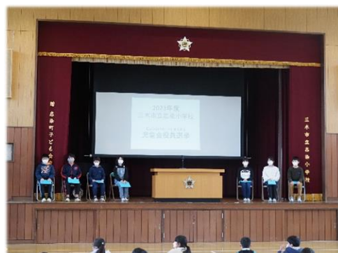
児童会選挙(立会演説会)

新しい児童会役員を決める立会演説会と投票が2月15日(水)に行われました。6年生が選挙管理委員となり、候補者が3～6年生児童の前で演説をし、投票によって新役員3名を決めました。演説では各候補者が「こんな志染小学校にしたい。」という思いを力強く訴えました。それぞれの候補者が自分の考えを力強く話すことができ、来年度の児童会に大きな期待を持つことができました。志染小学校の新6年生と志染小の子どもたち全員で志染小の新たなページを創ってほしいと思います。