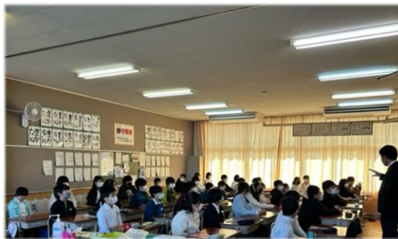
中学校の先生による出前授業(緑が丘小学校)

6年生は2月1日に緑が丘中学校の入学説明会に参加しました。校内のようすを見学し、中学校での生活の説明などを聞きました。また、2月27日には緑が丘小学校で緑が丘中学校の先生からの出前授業を体験しました。保健体育科と国語科の授業を体験しました。体育ではバトミントンを、国語では詩について学習しました。志染小学校の児童にとって、大人数の中での勉強を体験できたことは中学校生活に向けてのよい経験になりました。さらに、6年生は2月22日のスマイルスポーツ集会の企画・運営を行いました。みんなが楽しめる内容にするためいろいろと工夫をして実現していききました。クイズラリーでは、みんなの協力を得ながらたくさんの問題を考え、リレー形式にして楽しめるようにしました。大縄跳びでは6年生が縄回しの役となり、各スマイル班をチームとしてまとめられました。このように6年生は志染小のよきリーダーとして活躍しながら6年間の学校生活を締めくくろうとしており、とてもたのしいです。