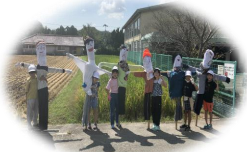
案山子といっしょに