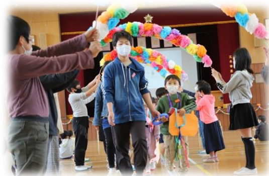
新入生を迎える会

新入生を迎え、1つ学年が上がった子どもたちは、とても張り切って学校生活を送っています。特に高学年の児童は上級生として学校を引っ張っていく自覚が生まれ、さまざまな場面でリーダーシップを発揮しています。登校する際には、後ろを何度も振り返り1年生の歩く速さにあ