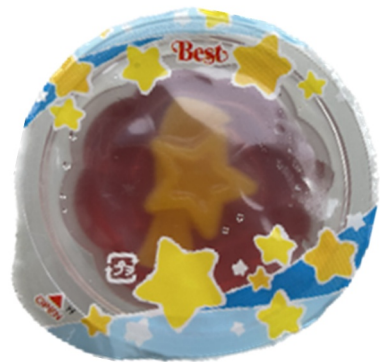
ほし お星さまゼリー