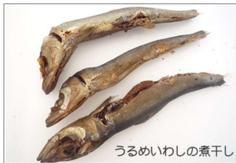
うるめいわしの煮干し