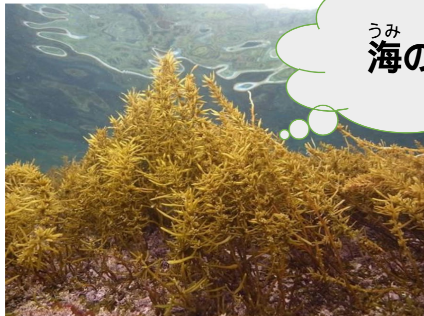
うみ なか 海の中のひじき