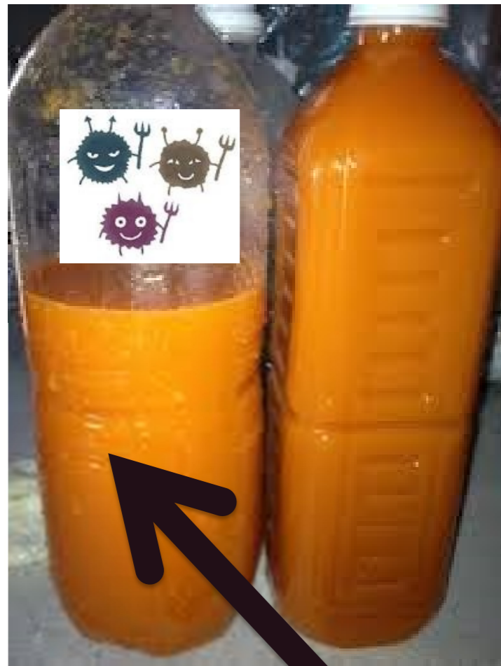
ペットボトル飲料の一般細菌数

ペットボトルの飲み残しを、部屋や、暑いところに置いておいたままにしていると、ばい菌が増えて、とつぜん爆発することがあります。