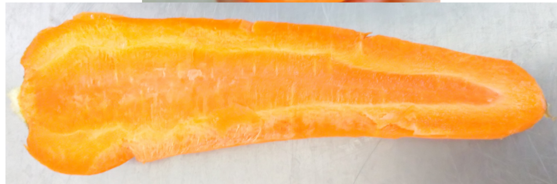
しん おお 芯の大きいにんじん