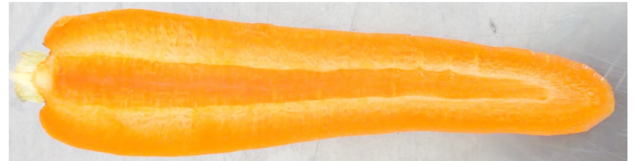
しん ちい 芯の小さいにんじん

しん おお そだ かた 芯の大きいにんじんは育ちすぎて固くなってい ます。また、葉っぱにたくさん栄養を取られている ので美味しくありません。