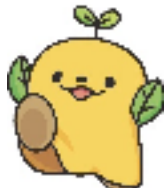
40周年記念キャラクター 「ふうすけ」