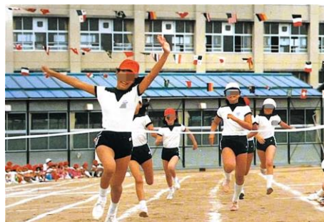
当時の運動会の様子