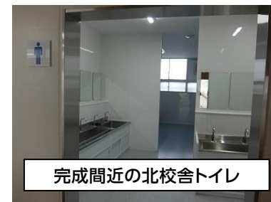
完成間近の北校舎トイレ

10月1日から、3階と4階のトイレが使用できるようになります。そして、11日からは、1階と2階のトイレも使用できるように、工事を進めていただいています。新しいトイレを覗くと、床も壁も全てがピカピカです。また、本校の手洗い場は蛇口が少なかったため、今回トイレに入る手前に、手洗いや水くみに使用できる蛇口も設置しています。美しく快適になったトイレです。使用する時は次に使う人のことも考え、優しい気持ちで大切に使いしていきたいものです。14日のオープンスクールの際には、ぜひご覧ください。