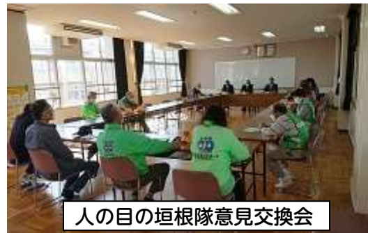
人の目の垣根隊意見交換会