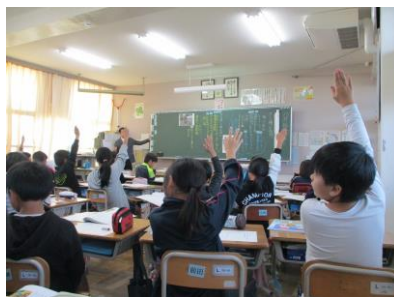
オープンスクール